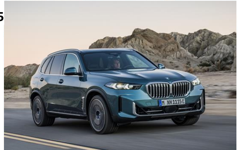
BMW X5 PHEV