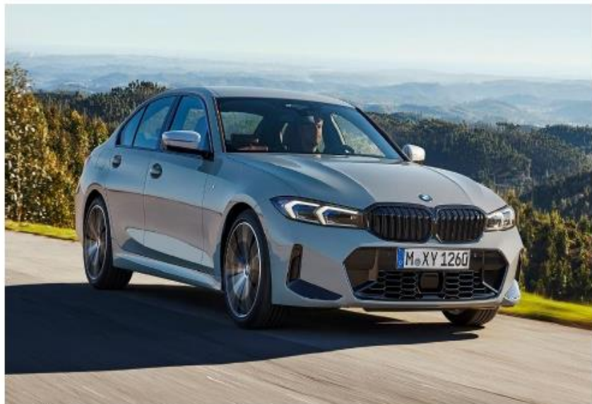
BMW Série 3