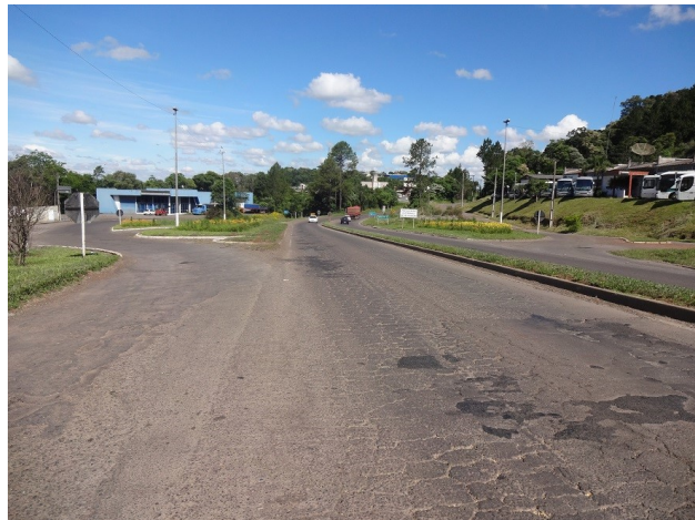
Acesso oeste de Joaçaba ( km 384,5)