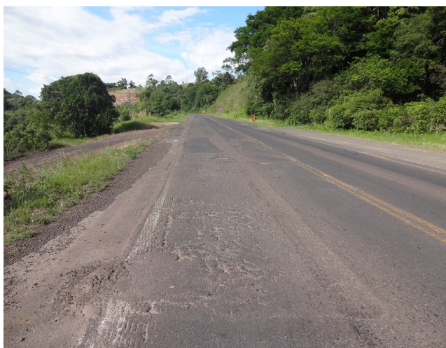
Km 93,8 - Capa asfáltica trincada e afundamento.