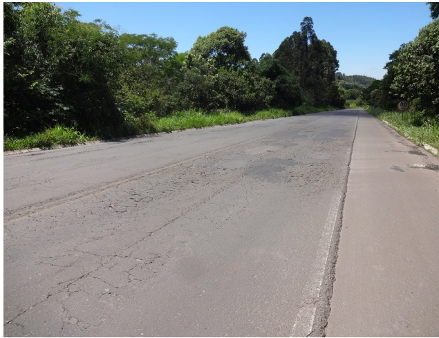
Trincamento do pavimento no km 107,5