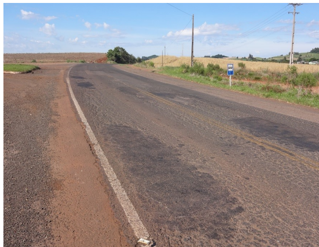
Situação do pavimento entre São José do Cedro e Guarujá do Sul - km 110