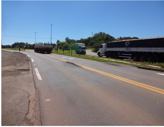
Acesso a Cunha Porã