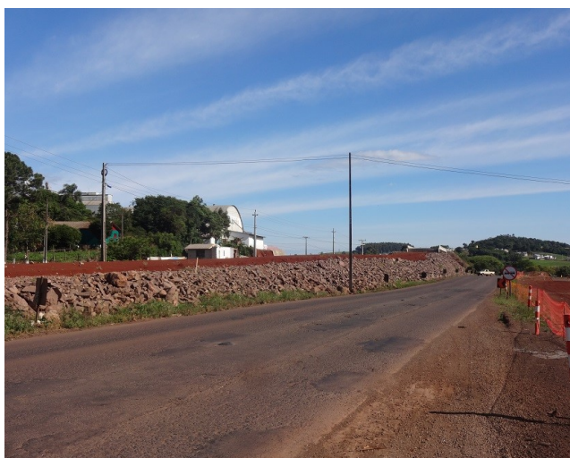
Viaduto no perímetro urbano de São José do Cedro