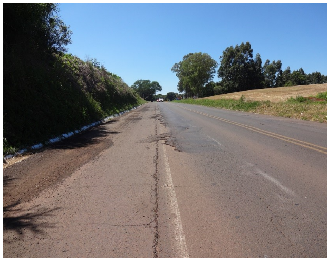
Km 572 - Situação do pavimento