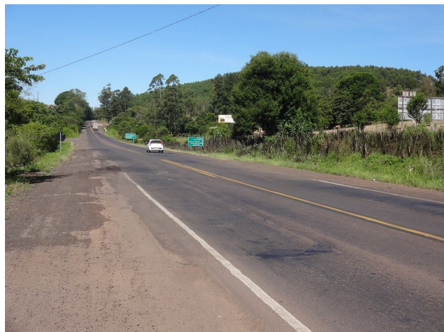
Km 634: Situação do pavimento