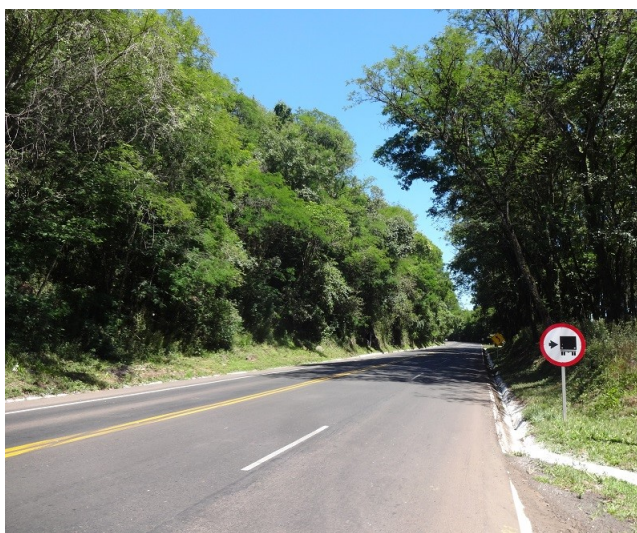
Do km 587 até ac. BR-158: Segmento já recuperado, inclusive terceira faixa