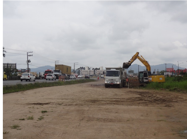
Km 6,0 - Únicas máquinas trabalhando, naquela ocasião.