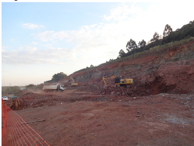
Execução de interseção de acesso a Concórdia