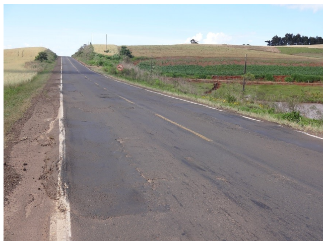
Trecho entre Guarujá do Sul e Dionísio Cerqueira ( km 117,6) – Com muitos buracos.