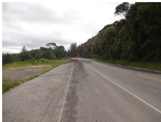
Escorregamento existente no km 106,6