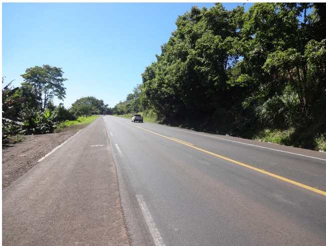
Segmento Xaxim/ Chapecó - km 527 - Recém-recuperado