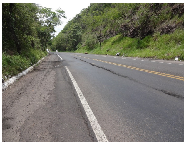
km 636 - Trilhas de roda que chegam a pegar embaixo dos carros