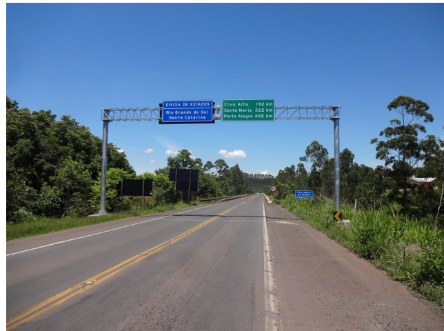
Divisa SC/RS- Ponte sobre o rio Uruguai