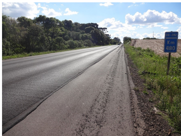
Km 480 - Micro revestimento executado