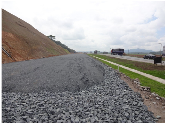
Base em execução - km 29 - (aprox. 400 m)