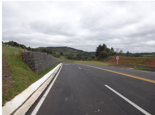
Km 246,5 - Situação do pavimento