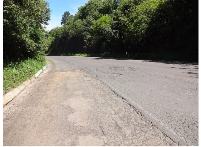
Pavimento danificado no km 143,5