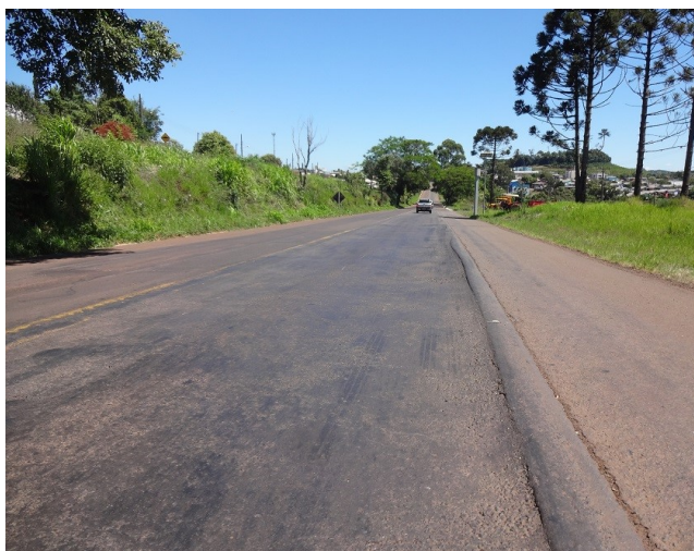
Km 579- Em Pinhalzinho. Situação do pavimento