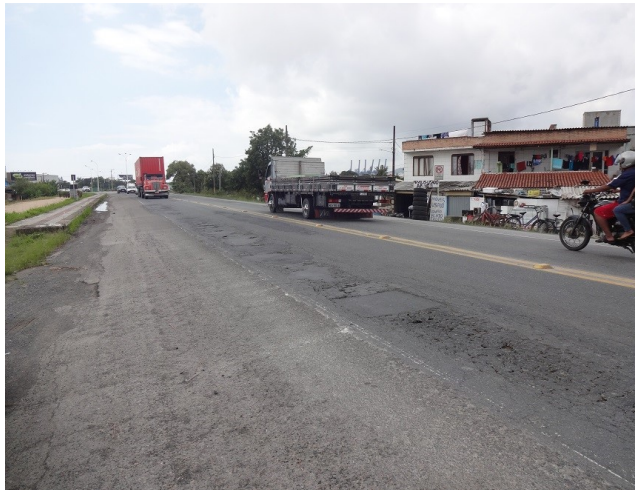
km 2,0 - Perímetro urbano de Navegantes