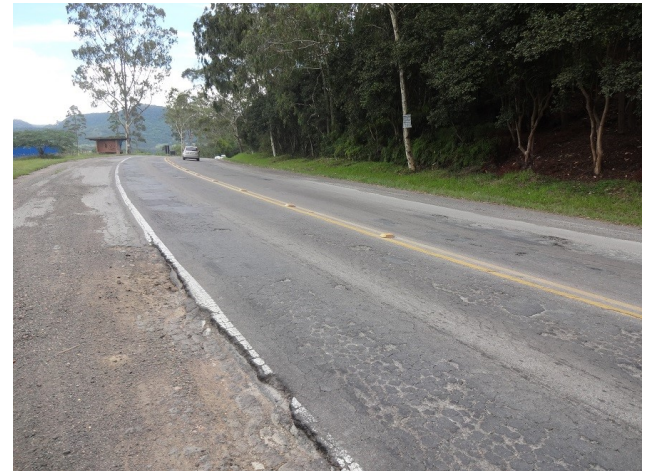
km 132,5 - Situação do pavimento até o km 12