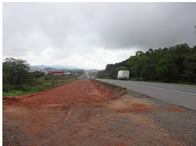
Vista da duplicação da pista- km 48,5