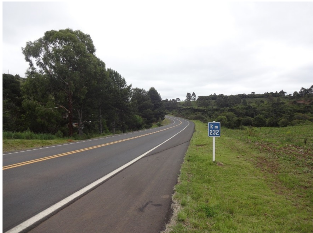
Excelente estado do pavimento - km 232

Este segmento apresenta um bom estado de conservação/ manutenção, conforme ilustrações a seguir: