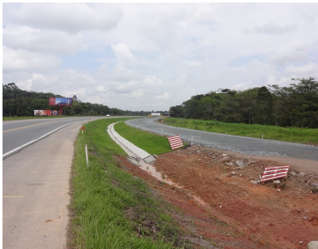
Início do lote 2 - Base da duplicação já executada. - km 20