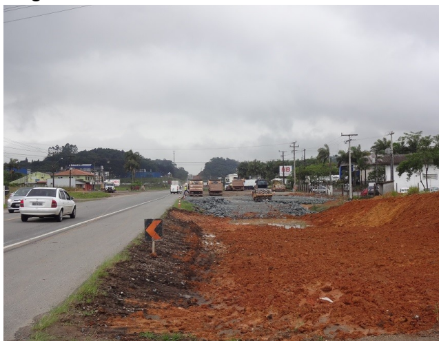
Obras de alargamento da pista - km 50