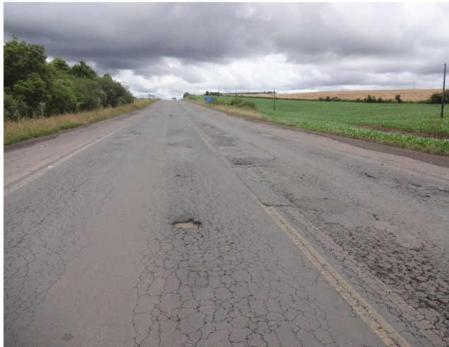
km 299,5 - Trincas de pavimento