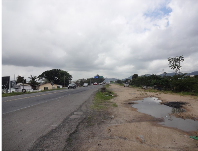
Estado de abandono do segmento entre Navegantes/ BR-101