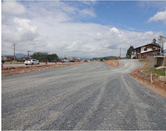
Acesso de Gaspar - km. 35,5