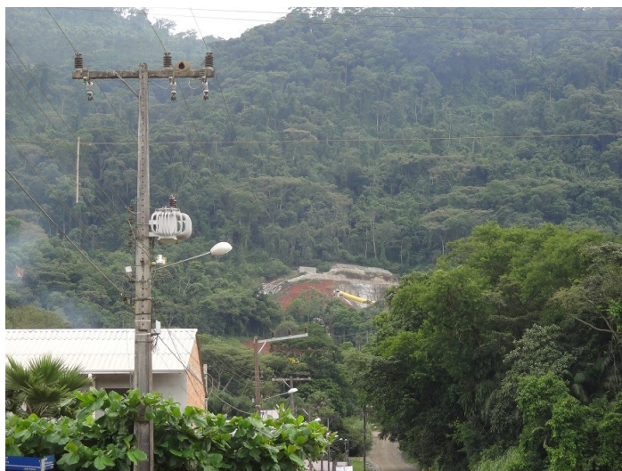
Obras de implantação do túnel duplo.