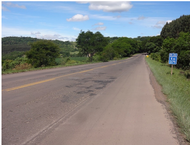
Situação do pavimento entre kms 375 e 378 (aproximadamente)