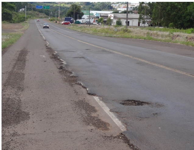
Km 72,5 entre SMO e Guaraciaba. Deterioração do pavimento