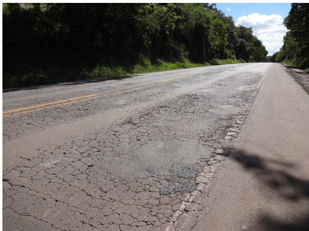
Deterioração do pavimento