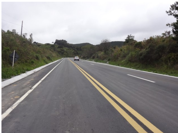
Segmento recuperado entre os kms 80 e 82