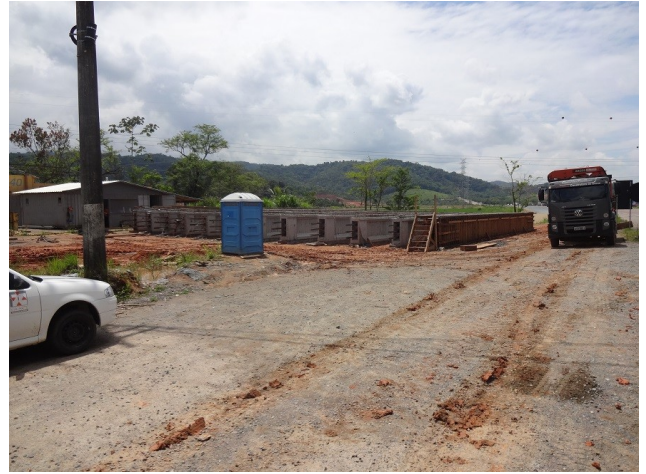
Ponte s/Rio da divisa Gaspar/ Blumenau - Vigas pré-fabricadas