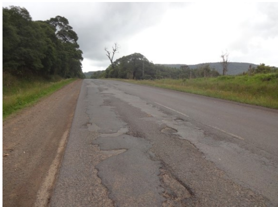
km 264 - Pavimento muito danificado (Pouso Redondo)