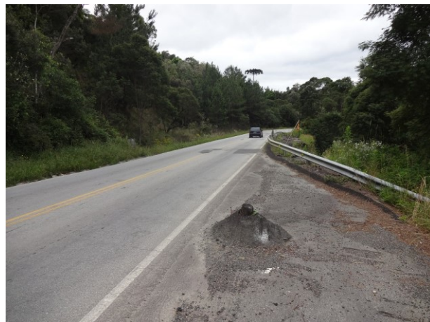
Necessidade de reparos entre kms 105 e 108 (Alfredo Wagner)