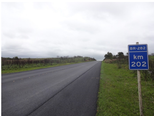
Km 202 - Recém recuperado. Aguardando sinalização