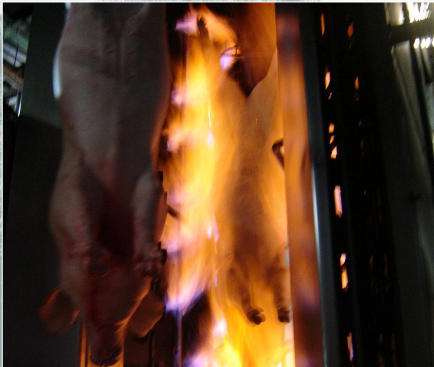
Chamuscador de suínos com GLP